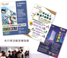
各行業活動宣傳海報

多個行業會透過資歷架構安排不同類型活動供中學同學參與，讓大家可以親身體驗實際工作，為未來從學校環境過渡至工作世界有更好準備。