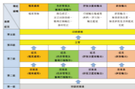
印刷業(印前職系)的進階路徑