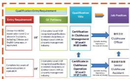
物業管理業職業資歷階梯 - 主要崗位