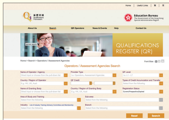
*「資歷名冊」搜尋頁面，可以不同關鍵字搜尋資歷。