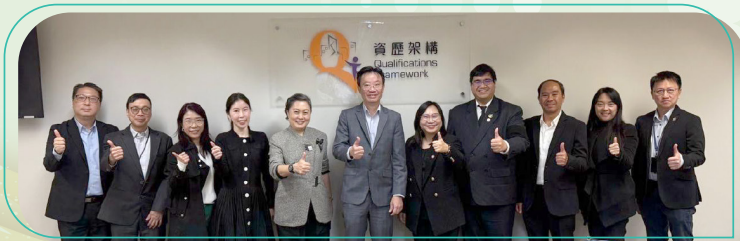
TPQI 到訪QF 秘書處。

泰國資歷架構當局Thailand Professional Qualification Institute (TPQI) 於11月20日到訪QF秘書處，互相交流以了解兩地資歷架構之最新發展及商討合作項目。