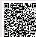
QF星級培訓機構 嘉許名單