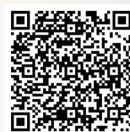
QF星級僱主 嘉許名單

除上述獲嘉許機構外，另有155間企業、商會、工會及專業團體獲發QF星級之友嘉許狀，以感謝其積極協助推動資歷架構。