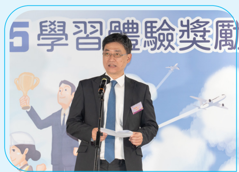
教育局副秘書長李忠善先生，JP致歡迎辭

教育局副秘書長李忠善先生，JP在茶聚上表示：「今屆計劃繼續以『陪你去得更遠』為主題，我們希望計劃能幫助從業員參與世界各地的學習活動，亦希望QF能協助大家在事業上持續進階，實現目標。」