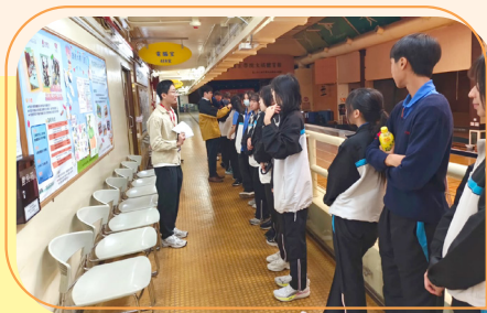
胡忠長者地區中心