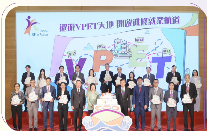
教育局局長蔡若蓮博士，JP（前排中）、香港學術及職業資歷評審局主席陳仲尼議員，SBS，JP（前排左五）、推廣職業專才教育和資歷架構督導委員會主席葉中賢博士，BBS，JP（前排右五）及資歷架構秘書處總經理黎英偉先生（前排右四），與QFIA Achiever代表合照