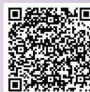
QF星級之友 嘉許名單