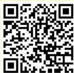
2024 QFIA 項目詳情

「QF in Action」計劃，每兩年為一屆，QFIA 2024共有18間機構（包括政府部門，業界及學界）連同其31間合作機構獲嘉許表揚。它們積極持續發展應用QF的项目，為不同行業注入專業化動能，讓各行各業的專才以職專作帆，遨遊職場。