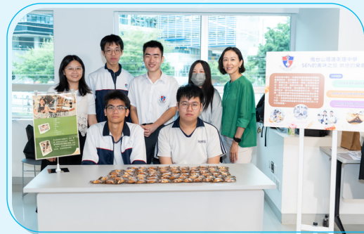
炮台山循道衛理中學同學派發親手製作曲奇

「學習體驗獎勵計劃」自2013年首辦至今已邁入第十三屆，吸引了超過2800名來自23個推行QF的行業從業員申請，其中已有逾750人獲獎。計劃旨在讓業內持續學習表現出色的從業員，透過參與本地或世界各地舉行的學習活動，例如行業比賽、研討會、考察團等，增廣見聞，認識行業的最新發展，擴闊視野及拓展網絡，從而為行業注入新動力。