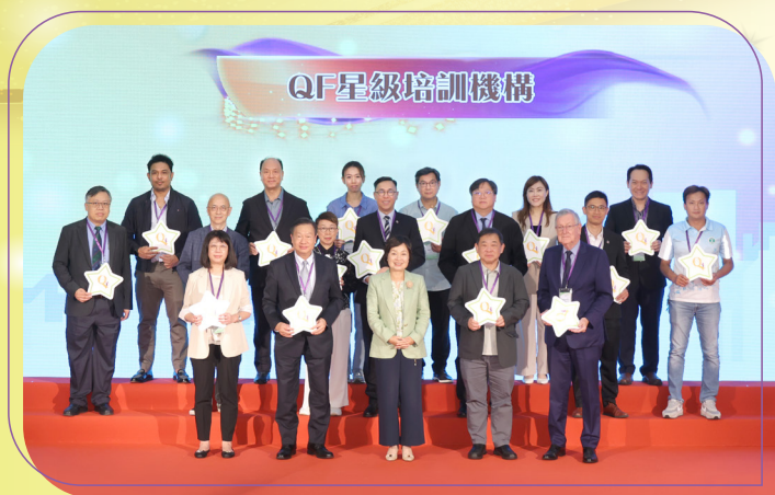
教育局局長蔡若蓮博士，JP與一眾「QF星級培訓機構」代表合照。

此外，亦有53間「QF星級培訓機構」獲嘉許，表揚他們積極發展「能力為本課程」、「通用能力為本課程」、「職業階梯課程」，或訂立「學分累積及轉移」措施，為學員提供更具彈性的進修機會。