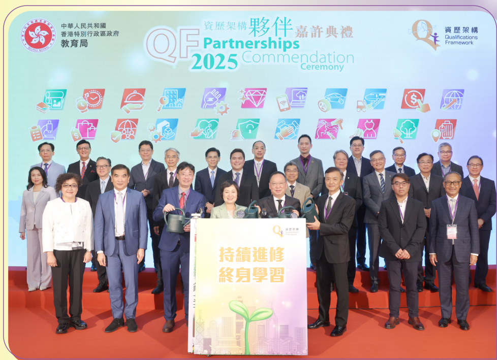
教育局局長蔡若蓮博士，JP(前排左四)、香港學術及職業資歷評審局主席陳仲尼議員，SBS，JP(前排右四)、推廣職業專才教育和資歷架構督導委員會主席葉中賢博士，BBS，JP(前排右三)及資歷架構秘書處總經理黎英偉先生(前排左三)，聯同22位行業培訓諮詢委員會主席或代表一同主持嘉許典禮開幕儀式。

「資歷架構夥伴嘉許典禮2025」於2025年9月16日順利舉行。在典禮上，教育局局長蔡若蓮博士，JP頒發嘉許狀予約200間機構，以表揚他們對資歷架構(QF)的積極參與和支持。今屆獲嘉許為QF金星級僱主的3間機構、QF星級僱主的91間機構以及53間星級培訓機構，均善用資歷架構的工具資源，促進行業持續發展。典禮上亦嘉許了2024 QFIA 的18個機構(包括政府部門、業界及學界)及其31個合作機構，數目和應用層面均為歷屆之冠。蔡局長期望更多機構加入應用QF的行列，為各行各業的持續發展增添活力。