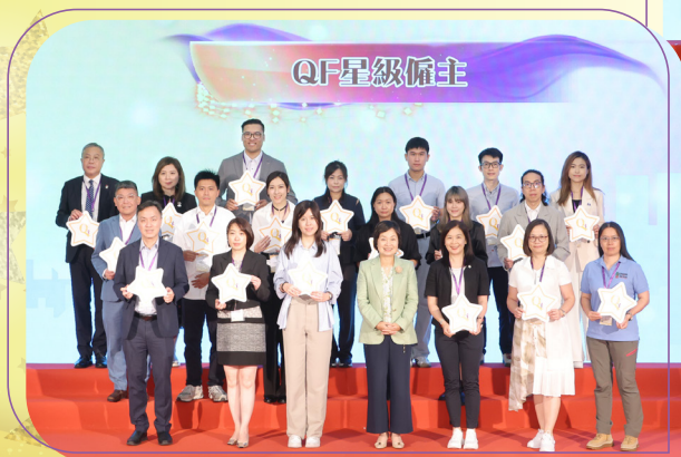
QF星級僱主致力應用QF的工具和配套，提高員工的競爭力和企業長遠發展。

今屆共有91間機構獲嘉許為「QF星級僱主」，表揚他們善用QF的工具為員工發展課程或提供認證，以提高員工的技能水平和促進企業的人才發展。