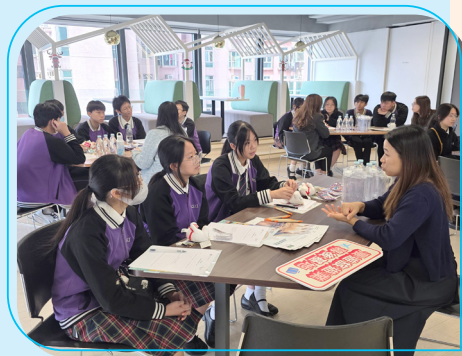
Corporate Travel Management 集團

旅遊業諮委會於2025年10月至11月舉辦了多場「漫遊旅遊業幕後基地」活動，安排修讀香港中學文憑旅遊及款待科的中學生參觀旅行社（包括香港中國旅行社、CTM集團及TCI勝景遊旅行社），深入了解本港旅遊業的幕後運作，並與業界人士互動交流。此活動旨在協助學生了解旅遊業的發展前景和晉升階梯，規劃未來升學和就業路向。