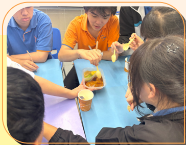
中華基督教青年會中學

QF帶你進入安老服務業 - 安老服務業導航計劃 日期：2025年11月7日 活動地點：中華基督教青年會中學 日期：2025年11月26日 活動地點：胡忠長者地區中心