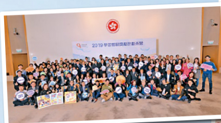
獎勵計劃之友茶聚(2019)

至今我們有超過630位獲獎者，每位背後都有一個精彩且激勵人心的故事。資歷架構自2016年成立「QF獎勵計劃之友」以來，為獲獎者們提供了一個平台，讓他們可以透過舉辦的活動和網上社群互相交流經驗和心得。希望你在未來加入「QF獎勵計劃之友」這個大家庭，令你的故事也被分享和傳頌。