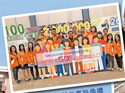
資歷架構夥伴嘉許典禮(2018)