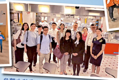
參觀中華廚藝學院(2018)