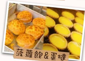
菠蘿包 & 蛋撻