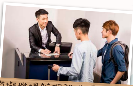
模擬機場辦理登機手續櫃檯