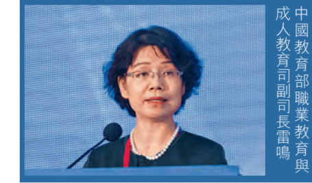
中國教育部職業教育與成人教育司副司長雷鳴

雷鳴在會議上，以「中國國家資歷框架建設現狀與發展」為題發表主題演講。他表示，中國國家資歷框架已於2016年啟動，並設立了10級的資歷框架，在中央政府指導下，在部分地方開展試點試驗。她續指，未來將進一步擴大試驗範圍，同時中央亦會訂立新法及修訂相關法規，為資歷架構提供立法框架，並會開展國際互認，有助各國的人才流動。