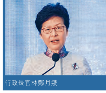
行政長官林鄭月娥

行政長官林鄭月娥在開幕禮致辭時表示，目前香港資歷架構已成為學術、職業專才、持續教育界別的可信憑證等級系統，並廣泛應用於各類企業的招聘、培訓及晉升層面上。她續指，本地的資歷架構亦獲得海外資歷架構當局的認可，於早年完成了與英國、蘇格蘭、愛爾蘭和新西蘭四國資歷架構的比較研究，肯定了本地資歷架構的質量保證系統水平。她又強調，資歷架構已成為香港走向知識型經濟的堅實基礎，為了進一步提升本地的教育質量，並為年輕一代提供高質素的學習和事業發展，政府今年向資歷架構基金注資12億元，加強推行有關工作。