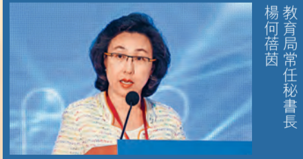
教育局常任秘書長楊何蔚茵

會議最後由教育局常任秘書長楊何蔚茵的閉幕辭作為總結。她表示，會議上的人士均受到本地講者以及歐洲、新西蘭、愛爾蘭專家的經驗之談所啟發，同時，得知愈來愈多國家在不久的未來將推出QF，實在令人鼓舞。